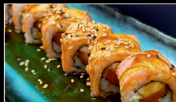
SP11 Teriyaki Madness 1a,2d,6,7,11 10.80€ Saumon, mozzarell, basilic, samon flambé, sésame, sauce teryaki