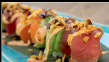
SP1 Spicy Rainbow roll 4g 12.80€ Poulet frit, mangue, saumon thon avocat spicy, chips