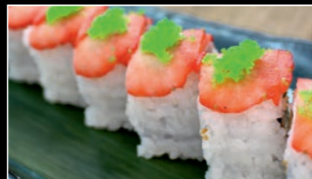
SP7 Strawberry tempura shrimp roll 10.80€ 1a,2d,11 Masago vert, tempura scampis, concombre, fraise