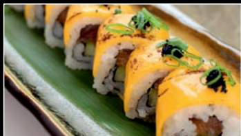
SP5 Cheese chicken roll 7 10.80€ Poulet frit, concombre, cheese, mayonnaise, masago noir, oignon vert