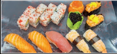
Plateau 4 (17 pièces) 2a,4b,4g,4h,4i 23.00€