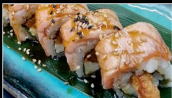
SP9 Teriyaki Wellness 1a,2d,6,7,11 11.80€ Scampis tempura, mozzarell, basilic, samon flambé, sésame, sauce teryaki