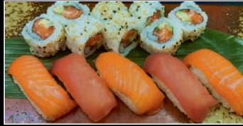
Menu B 13 pièces 4b,4g 3 Sushi Saumon / 2 Sushi Thon / 8 California Saumon Concombre