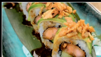
SP10 Teriyaki rock roll 1a,6,11 11.80€ Poulet frit, concombre, avocat, oignon frit, anguille sauce