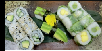
Menu végétarien 18 pièces 8 California Concombre Avocat / 8 Printemps Roll Mangue Asperge / 1 Sushi Asperge / 1 Sushi Avocat