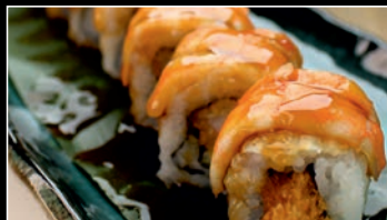
SP6 Teriyaki tempura shrimp roll 12.80€ 1a,2d,11 Tempura scampis, concombre, crevettes, cheese, anguille sauce