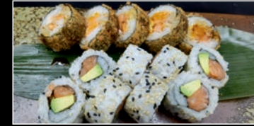
Menu C 13 pièces 1a,2d,3,4b,4d,4g,4h,6,7,11 8 California Saumon Avocat / 5 Hot Roll