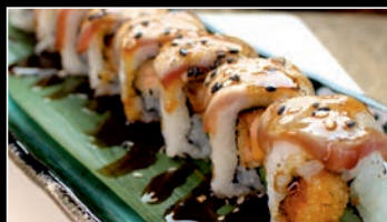
SP2 Tataki thon chicken roll 4b 12.80€ Poulet frit, concombre, thon mi-cuit, anguille sauce, sésame