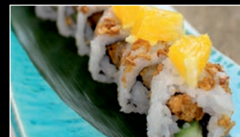
SP12 Canard orange 1a,6 9.80€ Canard, oignon frit, orange, miel