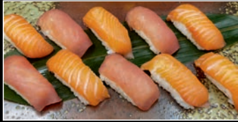
Menu A 10 pièces 4b,4g 6 Sushi Saumon / 4 Sushi Thon ou 10 Sushi Saumon

Seulement à midi du mardi au vendredi - sauf jours fériés!