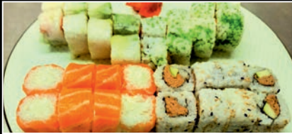
Plateau 5 (32 pièces) 2a,3,4c,4g,6,7,11 23.80€