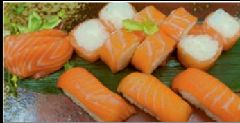
Menu D 14 pièces 4g,7 8 Saumon Roll Cheese / 3 Sashimi Saumon / 3 Sushi Saumon