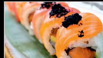
SP8 Tuna salmon roll 4b 12.80€ Saumon, avocat, saumon,thon, masago noir