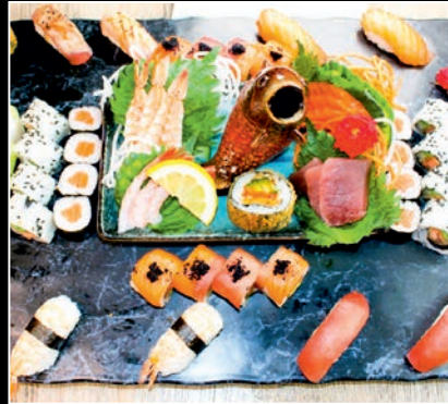
Plateau 7 (57 pièces) 1a,2a,4b,4g,4h,4i,7,11