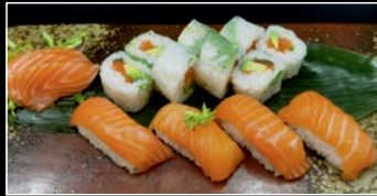
Menu E 14 pièces 4g 8 Printemps Roll Saumon & Avocat / 4 Sushi Saumon / 3 Sashimi Saumon