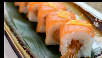
SP4 Salmon tempura shrimp roll 2d,4g 11.80€ Tempura scampis, saumon, masago rouge, Citron râpé