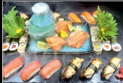
Plateau 8 (pour 2 personnes) (51 pièces) 2a,4b,4g,7