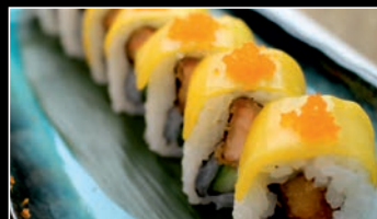
SP3 Mangue chicken roll 11.80€ Poulet frit, concombre, masago rouge